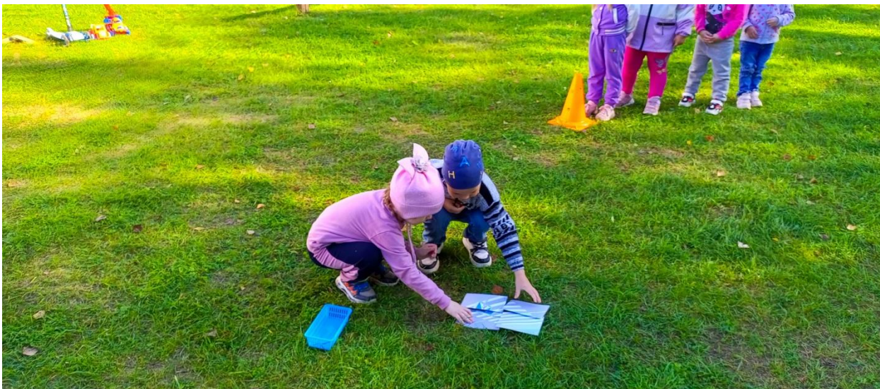
Игра «Жезл инспектора»