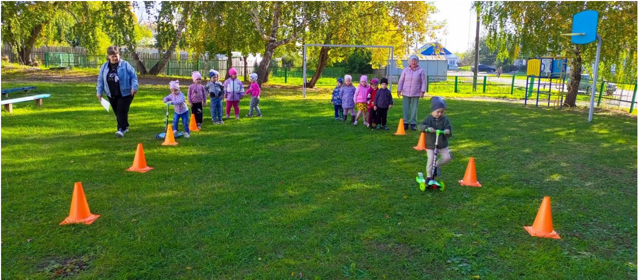
Игра «Водитель» (Машины на веревке)